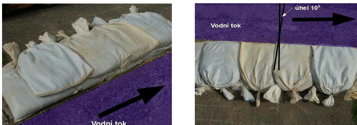
Obrázek 2: Jednořadé kladení pytlů