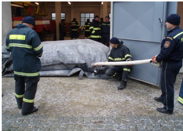
Obrázek 1: Mobilní protipovodňové bariéry